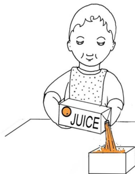
Dziecko nalewa sok do pudełka