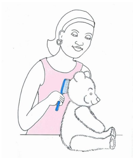
Pani czesze misia