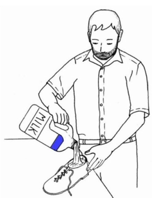
Pan nalewa mleko do buta