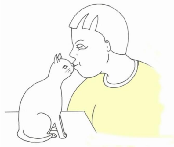
Chłopiec całuje kota