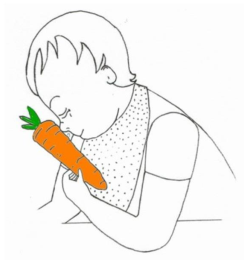
Dziecko wącha marchewkę