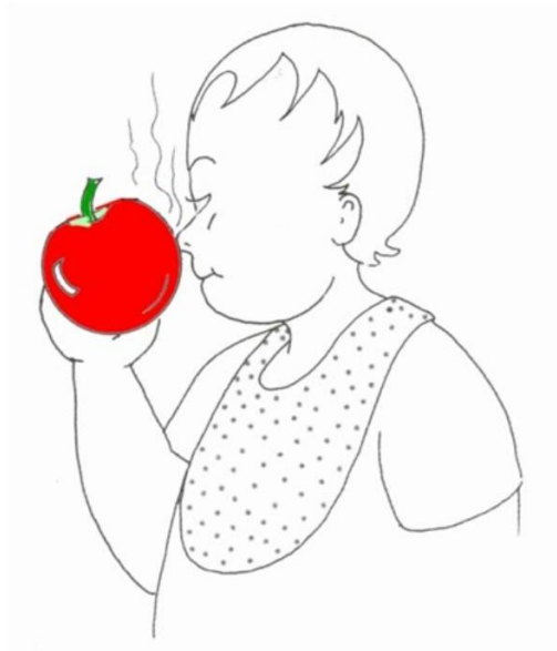
Dziecko wącha jabłko