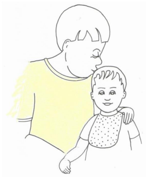
Chłopiec całuje dziecko