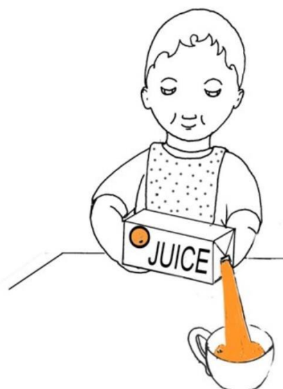
Dziecko nalewa sok do kubka