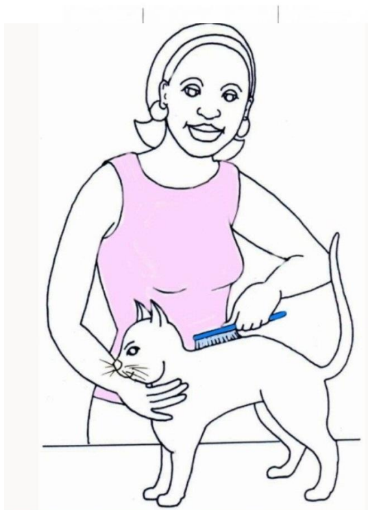
Pani czesze kota