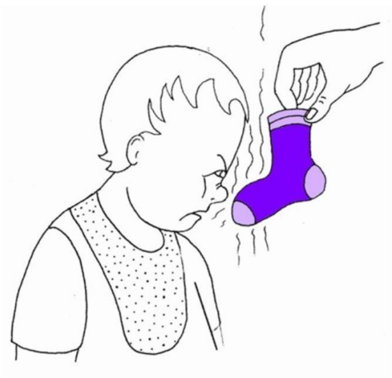
Dziecko wącha skarpetę