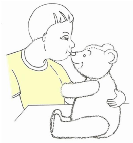
Chłopiec całuje misia