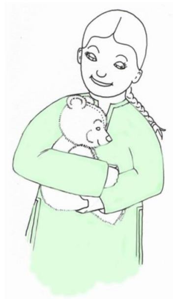
Dziewczynka przytula misia