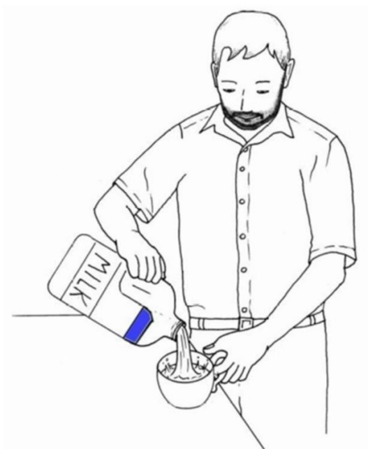
Pan nalewa mleko do kubka