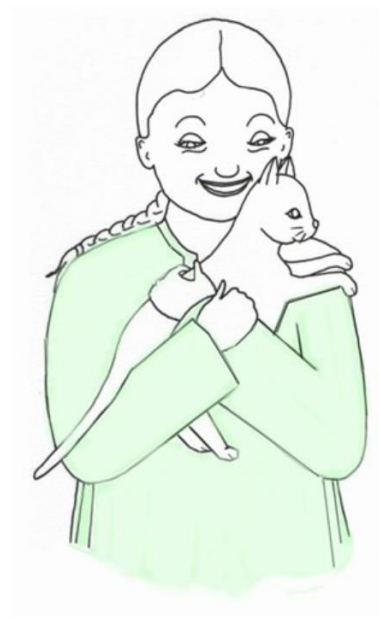
Dziewczynka przytula kota