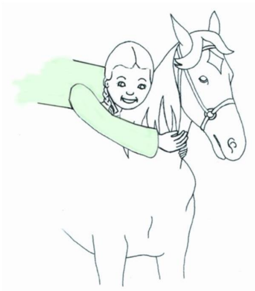
Dziewczynka przytula konia