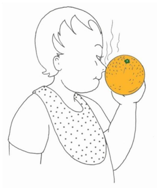
Dziecko wącha pomarańczę