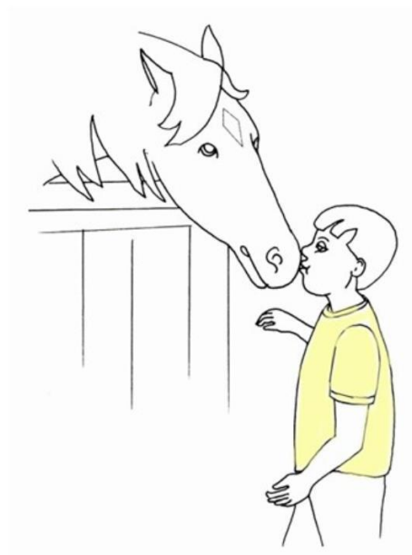
Chłopiec całuje konia