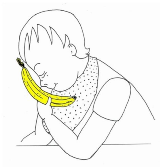
Dziecko wącha banana