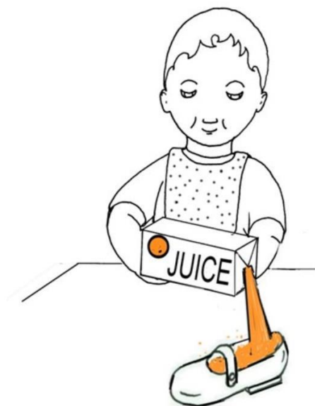
Dziecko nalewa sok do buta