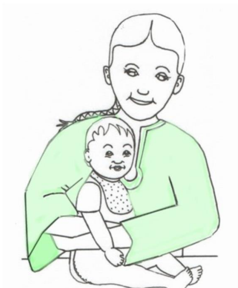
Dziewczynka przytula dziecko