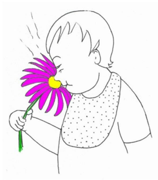
Dziecko wącha kwiat