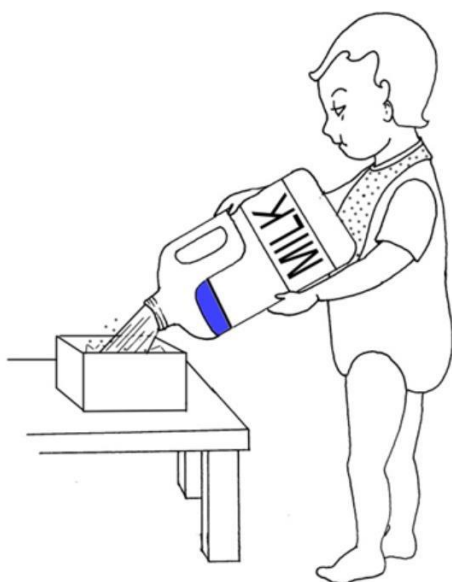
Dziecko nalewa mleko pudełka