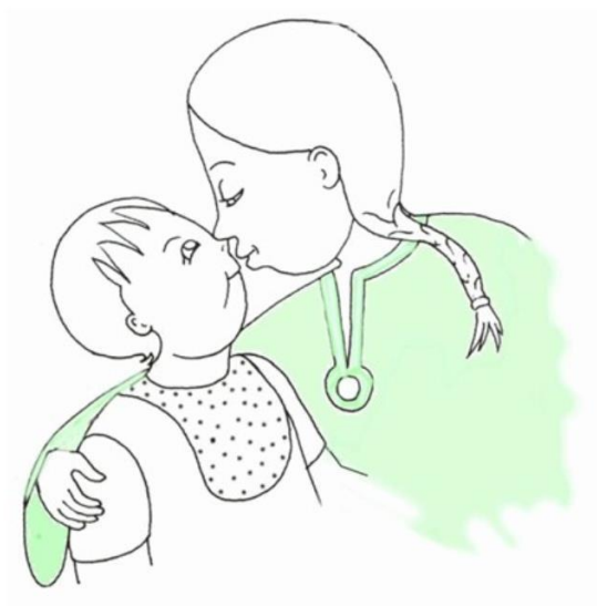
Dziewczynka całuje dziecko